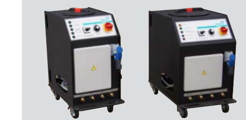
WMS40 - 40 LITRES