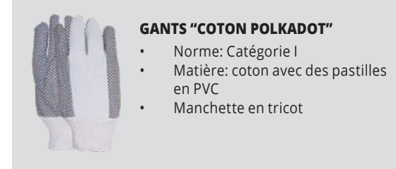
GANTS "COTON POLKADOT" • Norme: Catégorie I • Matière: coton avec des pastilles en PVC • Manchette en tricot