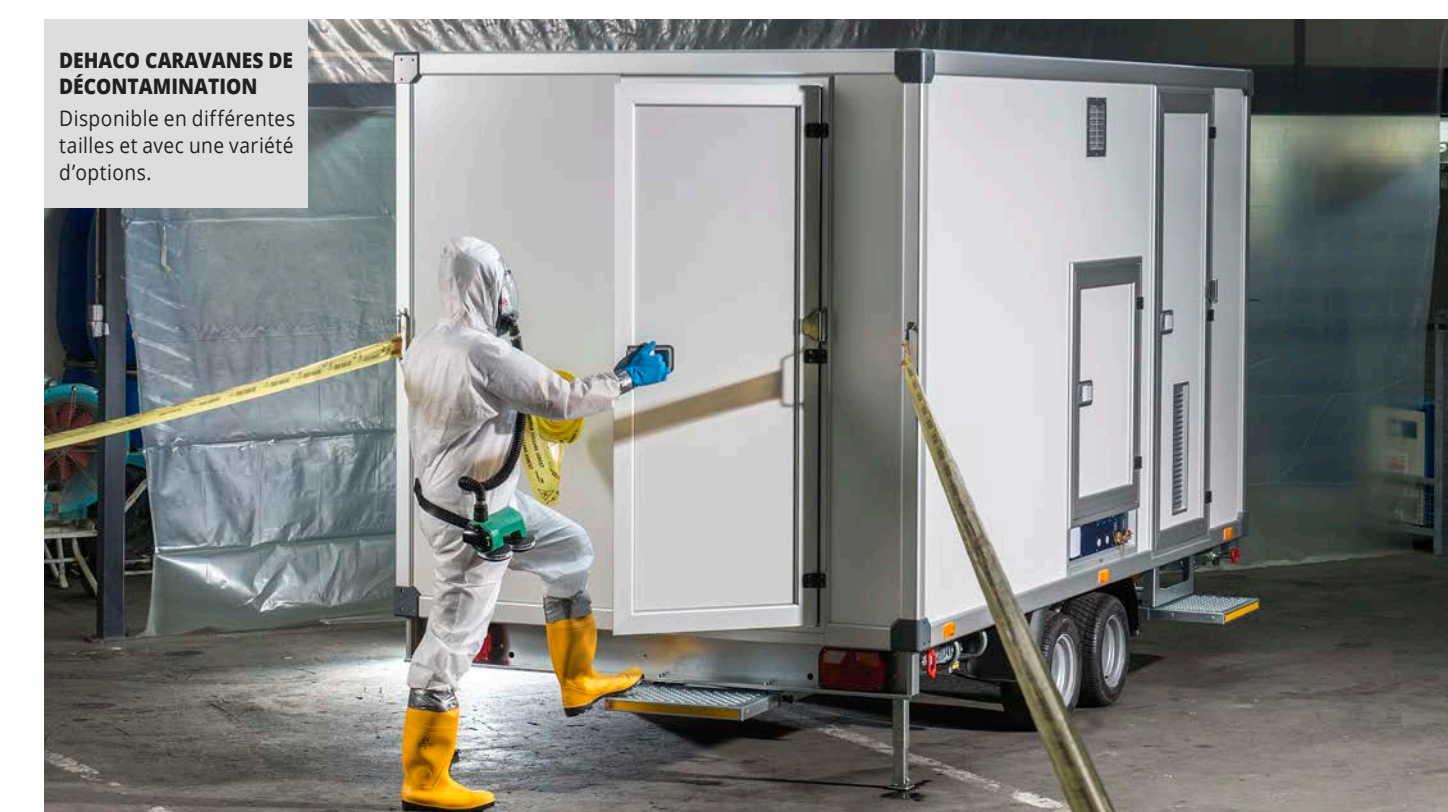
DEHACO CARAVANES DE DÉCONTAMINATION Disponible en différentes tailles et avec une variété d'options.