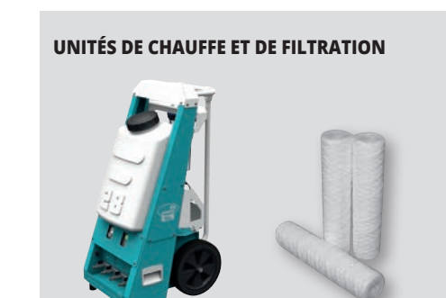
YO28 - 32 LITRES

Le Dehaco BulkAir moniteur de dépression est la technologie la plus récente en matière de contrôle de la dépression. Il est équipé des capteurs de pression numériques les plus récents, pour des relevés de pression considérablement plus stables et précis. Le BulkAir peut être complété par un autocommutateur et une alarme visuelle LED.