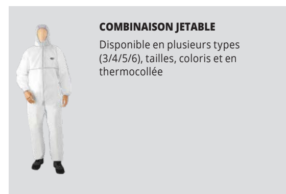
COMBINAISON JETABLE Disponible en plusieurs types (3/4/5/6), tailles, coloris et en thermocollée