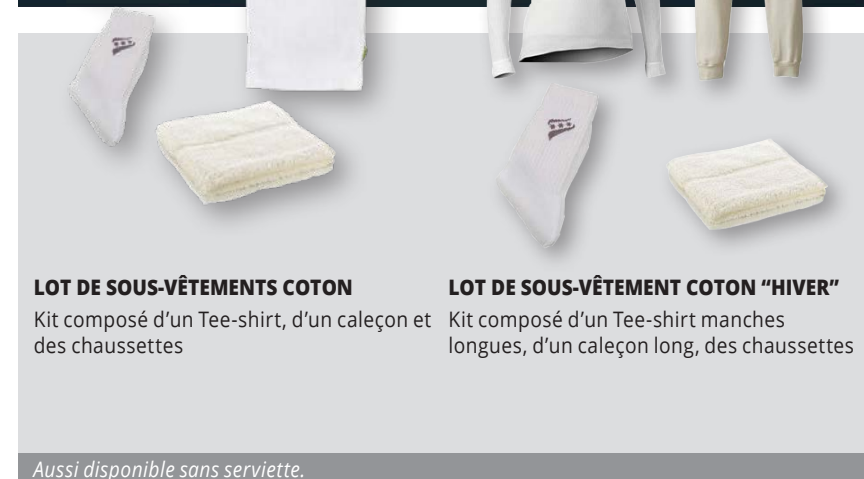
LOT DE SOUS-VÊTEMENTS COTON Kit composé d'un Tee-shirt, d'un caleçon et des chaussettes