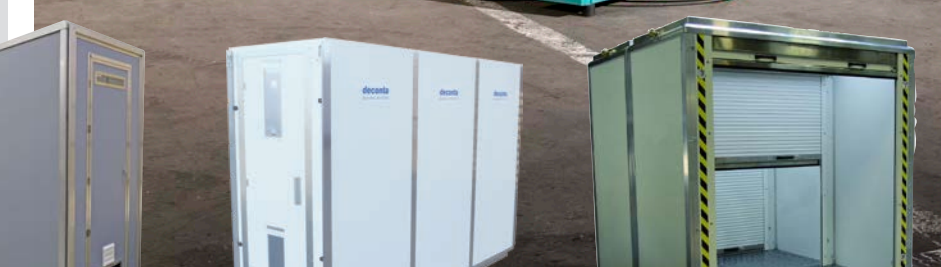
SAS DÉMONTABLE Disponible en 3-, 4- & 5 compartiments 89 x 89 x 203 cm par compartiment 100 x 100 x 203 cm par compartiment