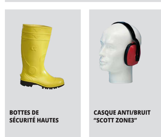
BOTTES DE SÉCURITÉ HAUTES