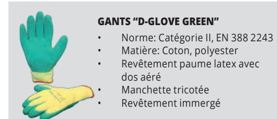
GANTS "D-GLOVE GREEN" • Norme: Catégorie II, EN 388 2243 • Matière: Coton, polyester • Revêtement paume latex avec dos aéré • Manchette tricotée • Revêtement immergé