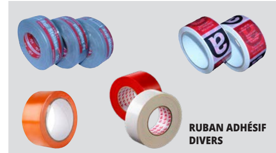
RUBAN ADHÉSIF DIVERS

QT10 horizontal QT14 horizontal QT18 horizontal QT30 horizontal V10 vertical V24 vertical