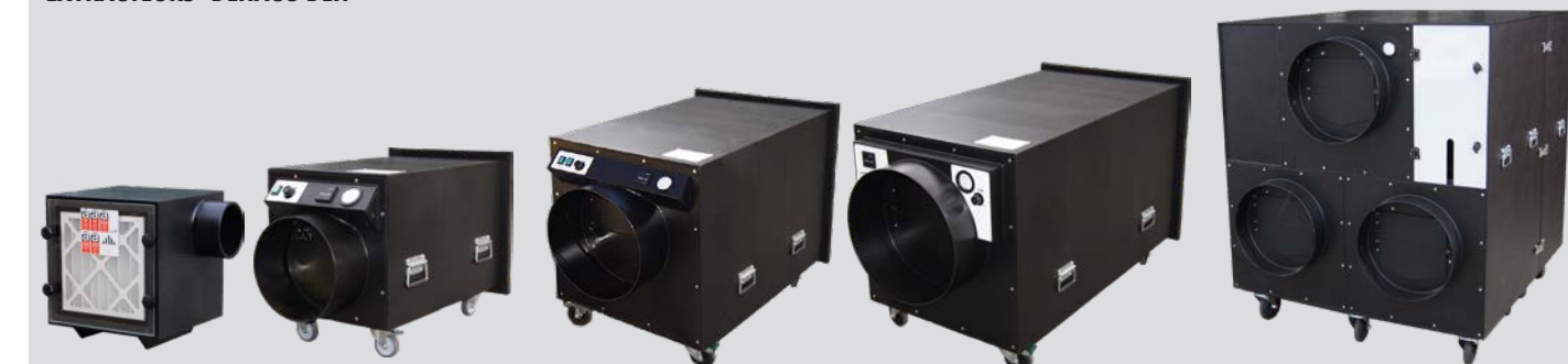
DEH750 Débit: 750m³/h