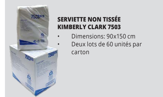
SERVIETTE NON TISSÉE KIMBERLY CLARK 7503 • Dimensions: 90x150 cm • Deux lots de 60 unités par carton