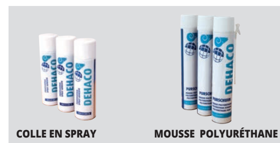
COLLE EN SPRAY