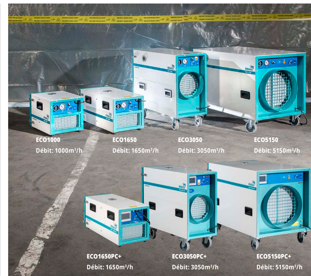
ECO1000 Débit: 1000m³/h