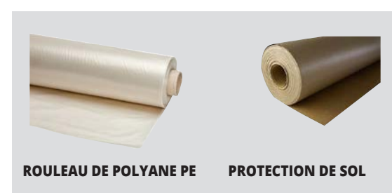
ROULEAU DE POLYANE PE