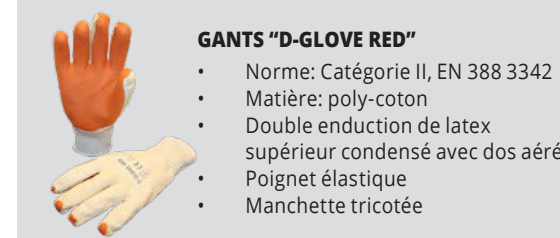
GANTS "D-GLOVE RED" • Norme: Catégorie II, EN 388 3342 • Matière: poly-coton • Double enduction de latex supérieur condensé avec dos aéré • Poignet élastique • Manchette tricotée